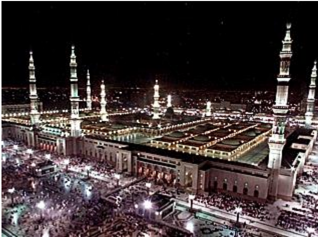
Ansicht der großen Moschee in _____

Muslimen nach Äthiopien gegeben. Das Jahr der Hidschra (= _____) gilt bis heute als das Jahr eins der islamischen Zeitrechnung.